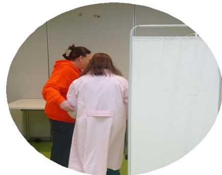
Votaciones para la Junta de la Cooperativa