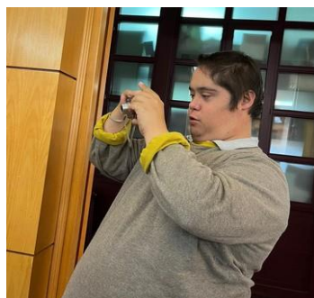
Nuestro fotógrafo Pelayo