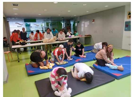
Ejercicio de RCP: Entrenar para salvar vidas

El 16 de octubre se realizó de forma presencial en Gijón y telemáticamente en otras zonas de Asturias, el III Récord de RCP, todos/as las participantes realizamos a la vez una RCP que duro dos minutos. Nosotros/as ensayamos la RCP algunas semanas para que nos saliera lo mejor posible. Además, nos ayudó a recordar que este ejercicio puede salvar vidas.