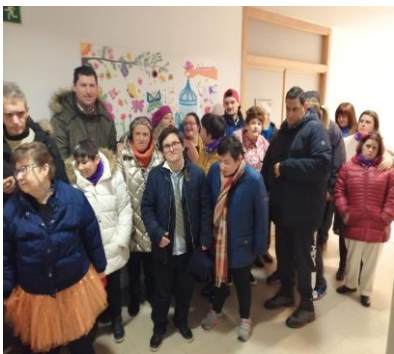
Exposición en el Polivalente