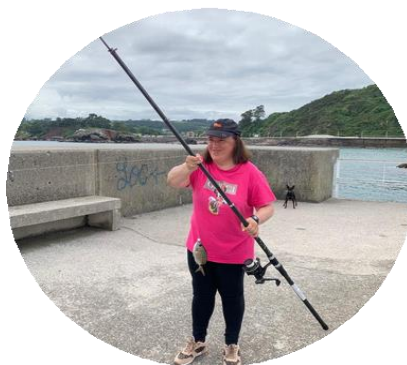
Taller de pesca