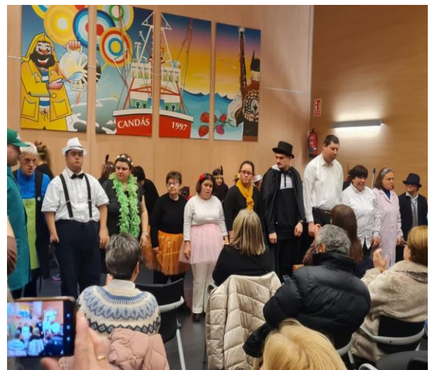
Fotos: Actuación de teatro en la celebración del Día de la Discapacidad del año pasado.