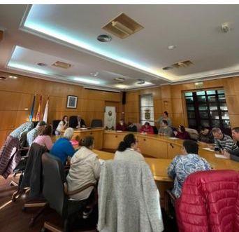
Reunidos en el Ayuntamiento con el alcalde