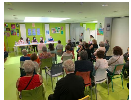
Presentación de un libro