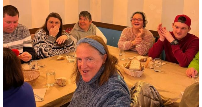
Nosotros sentados en el restaurante antes de empezar a comer

Con el dinero que ganamos en la cooperativa, vendiendo nuestros productos en el mercado de Gijón en el mes de mayo pasado, decidimos en asamblea ir a algún restaurante de la zona a comer. Fuimos todos y todas, incluidas las monitoras, a comer a un restaurante italiano en Candás. Antes de comer fuimos a tomar el "vermut". Comimos muchísimo, de primero había para elegir pizza o puré. De segundo risotto a la milanesa o patatas con criollo, y de postre había tartas, helados y flanes. Estaba todo muy rico.