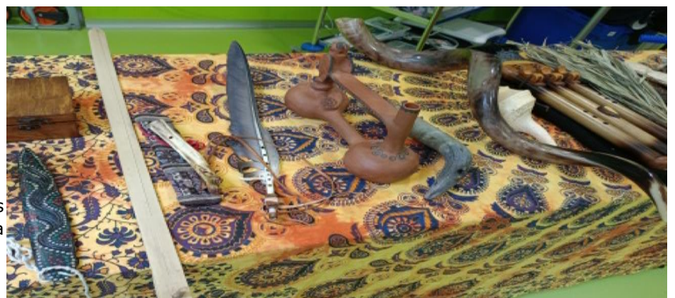
Diferentes instrumentos ancestrales como la flauta hecha con una pluma de buitre.