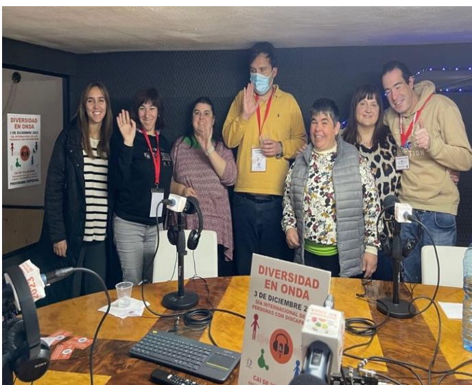
En la Radio