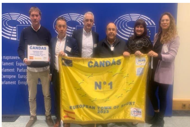
europa de 2023

Carreño ha conseguido este premio gracias al esfuerzo del concejo y de sus vecinos. Este reconocimiento ha sido posible gracias al esfuerzo de todos/a, deportistas, asociaciones y entidades que siempre han contado con el apoyo y la inversión pública necesaria para continuar siendo una villa deportiva reconocida y avanzar para conseguir nuevos éxitos.