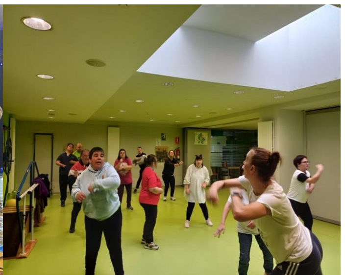
En la clase de Zumba